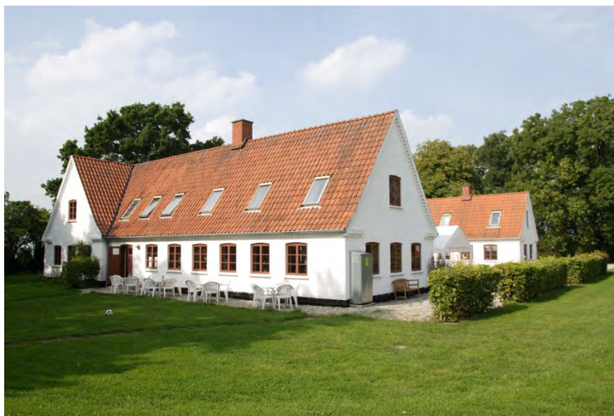
Hegnegaarden Udviklingscenter på Orø

Hegnegaarden er en 3-længet gård. Den ligger på Orø, smukt omgivet af marker og skov, tæt ved vandet. Den har sin egen specielle charme og er et inspirerende sted at arbejde med udvikling.